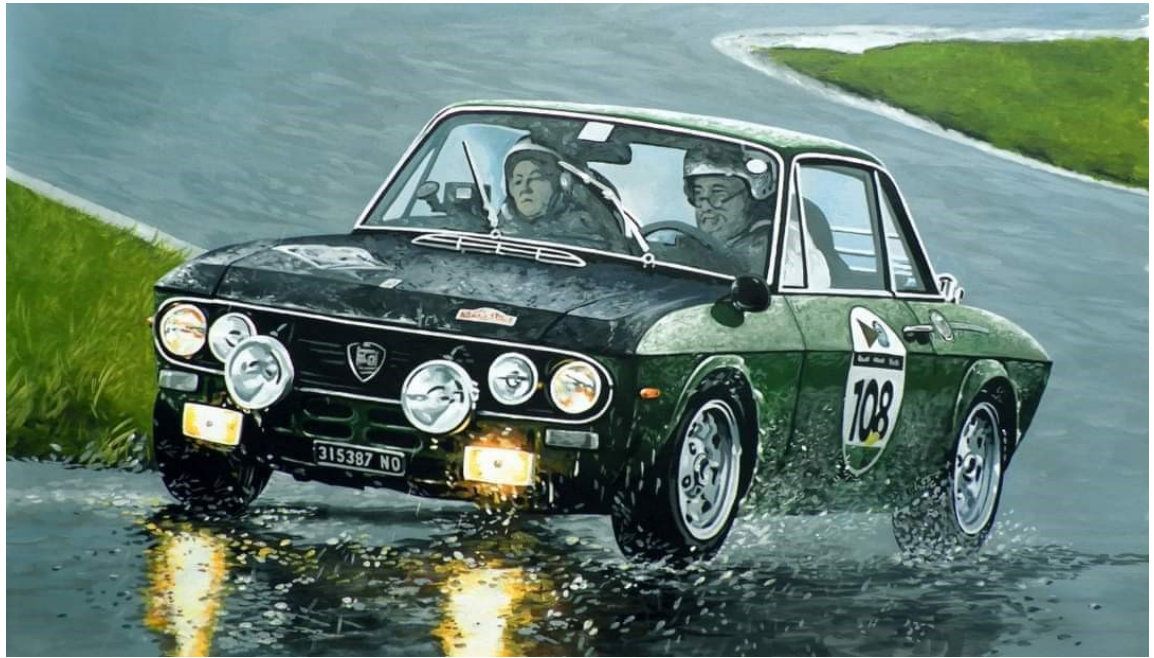
La Foto vincitrice a gennaio del concorso "La foto Del Mese" per Garestoriche.

Cominciamo quindi con la prima edizione dove partendo dalle news regolamentari, passeremo in rassegna le prime gare invernali a calendario, non mancheranno le anticipazioni sulle prime serie nazionali e locali... Buona lettura.