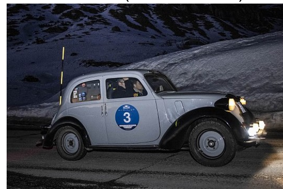
I vincitori durante la gara

Gli appuntamenti non sono conclusi qui: Interessante anche la disputa dei trofei spettacolo sul lago ghiacciato riservati rispettivamente alle prime 8 Porsche classificate (Trofeo Centro Porsche Brescia) e ai primi 32 assoluti della Winter Marathon (Trofeo Eberhard).